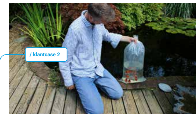
/ klantcase 2

Een traject als dit kost tijd. Stap voor stap gaat de samenwerking vooruit. De hoge kosten worden blijvend kritisch bekeken en waar mogelijk verlaagd. Ook privé gaat het goed. Na 1,5 jaar functioneert de huisarts weer op haar oude niveau. •