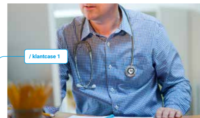
/ klantcase 1

mogelijkheden zijn er? Is de ondernemer (op termijn) in staat de onderneming voort te zetten? Kan hij weer teruggebracht worden naar het niveau van voor de arbeidsongeschiktheid? De adviseurs van Vitale Zaken gaan in gesprek met de arbeidsdeskundige en de ondernemer en bekijken wat haalbaar is. Met de juiste coaching en begeleiding groeien we toe naar een gezonde toekomst. •